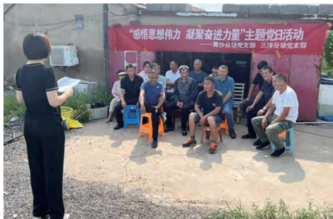
8月1日上午,青口投资公司三洋分场、黄沙分场党支部,在三洋分场生态养殖示范塘联合开展“感悟思想伟力 凝聚奋进力量”主题党日活动,共同学习《习近平著作选集》(卢伯斌 黄阿凡)