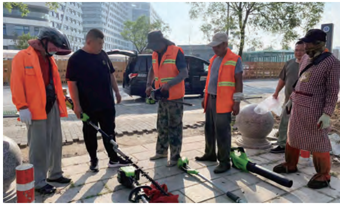
为进一步提升绿化员工专业技能,打造一支高素质绿化养护队伍。近日,华茂裕升分公司组织绿化机械设备操作技能培训活动,采用“师带徒”“手把手”培训形式,对8名员工进行技能培训。(王艺璇)

聚焦基础管理,持续提质增效。深入开展“基础管理提升年”,以“算账”文化为统领,推进“全面预算—绩效考核—薪酬分配”一体化融合体系建设;科学运用“利润=收入-支出”这个公式,深入推进“业财”融合,通过“三增三降三优三提”,提升经营质效,实现从生产者向经营者转变,进而向竞争者转变。(许佃来)