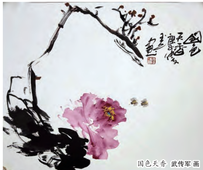
国色天香 武传军画

读书可以改变容颜,可以陶冶情操,可以提升气质,可以遇见更好的自己。读万卷书,行万里路,脚步丈量不到的地方,文字可以。读书,可以使自己成为最自由的风。