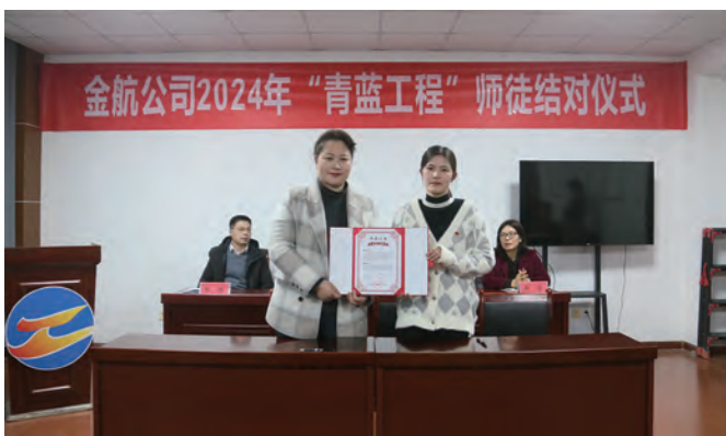
3月25日下午,金航公司工会开展“青蓝工程”师徒结对活动。选拔了10名德才兼备的“老兵”作为师傅,对机关35周岁以下的年轻干部实行“一对一”“一对多”“多对一”结对帮带,好地促进青年职工的成长和发展。(武田原)

抓重点,强化厂务公开的监督检查。联合采用听汇报、看现场、查资料、员工满意度测评等多种方式检查厂务公开实施情况。对于未公开或公开不全面的下发整改通知单,跟踪整改落实结果,确保实现“应公开尽公开”。(韩奇)