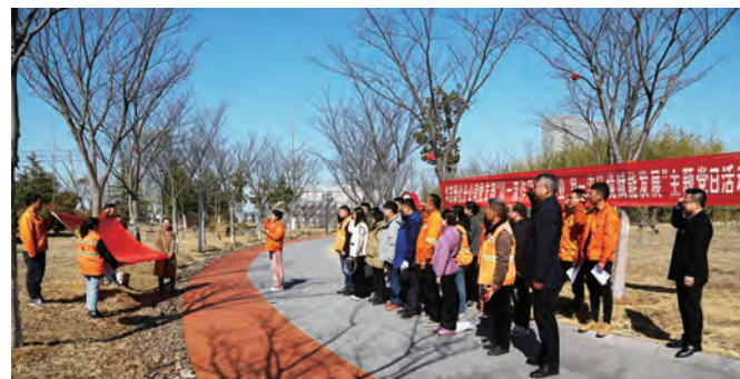
日前,台北投资公司各党支部分别开展“以一流作风干事创业、用一流环境赋能发展”主题党日,结合“解放思想 实干担当”实践月活动,组织广大党员开展党员宣讲、座谈、志愿服务等系列活动,全面提升基层党建质量,保障经济发展。